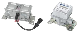
Система учета расхода топлива